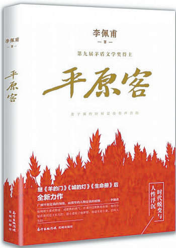
《平原客》 李佩甫 著

在辽阔无际的平原上，每一个人就如一棵棵植物般都是过客，于不知不觉间走向成熟，而当麦子黄的时候，每位平原客是否结出了内心深处想要的果实？如人饮水，冷暖自知。平原和这些来客的关系，就像土壤和植物一样密不