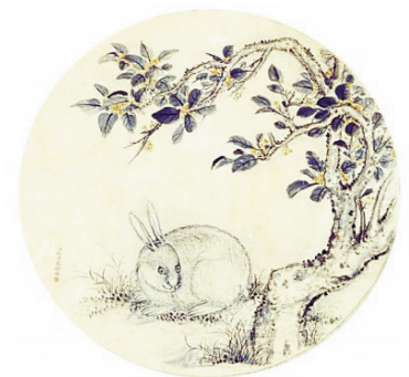
月中桂兔图(中国画·局部) 蒋溥(清代) 作 故宫博物院藏