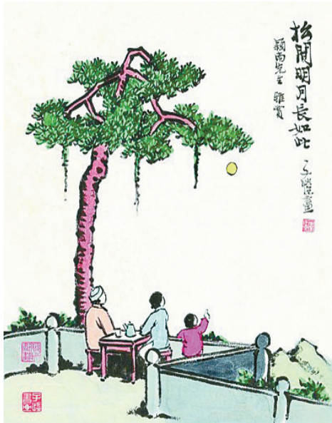
松间明月长如此（中国画） 丰子恺 作

丹桂飘香,人间月圆。在这秋风送爽、花好月圆之时,我们又一次迎来中华民族的传统佳节——中秋。作为中国四大传统节日之一,中秋节起源于古代,自唐宋后逐渐盛行,其深厚的文化韵味、多彩的节日习俗、丰富的精神内涵经千年演进而历久弥新。