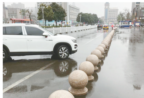
漯河火车站出站口对面，石墩占用公共道路，影响车辆调头。