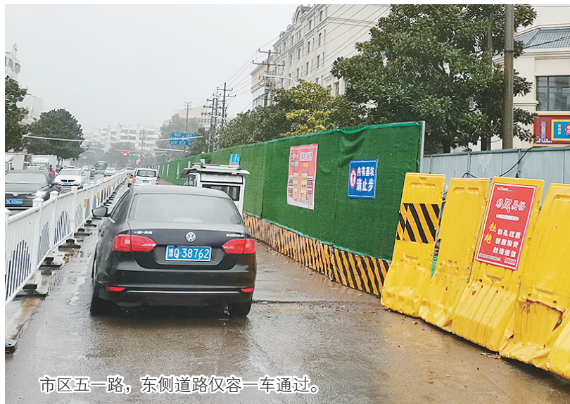
市区五一路，东侧道路仅容一车通过。