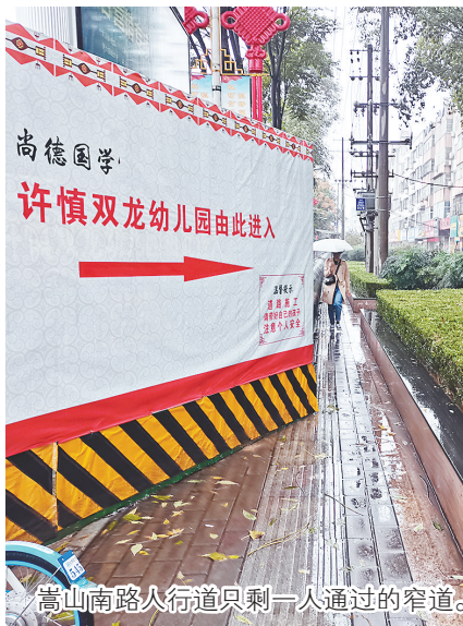
嵩山南路人行道只剩一人通过的窄道。