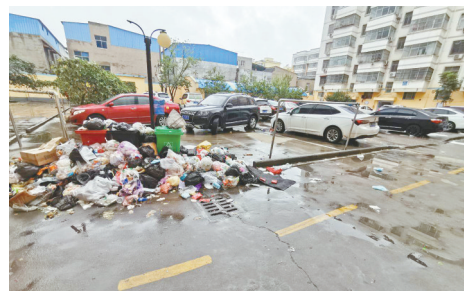
银鸽大道碧嘉苑小区，生活垃圾堆积无人清理。