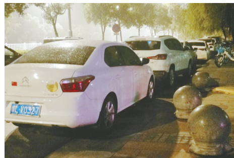
嘉业城市花园一期南门西侧，私家车违规停放影响通行。