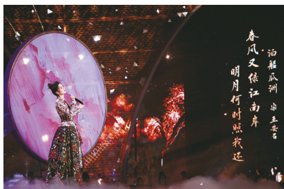
《经典咏流传》第三季