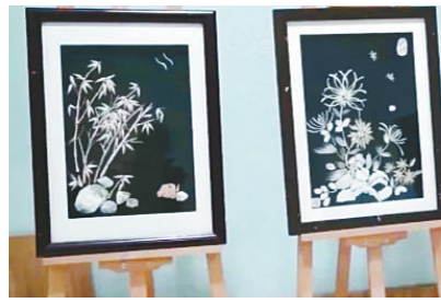
高思信老人创作的鱼骨画。

奶奶说，她年轻时常去书店买时装书，回来照着书上的样式和教程自己做衣服，儿子小时候的衣服都是自己做的。在这位奶奶眼中，她更喜欢