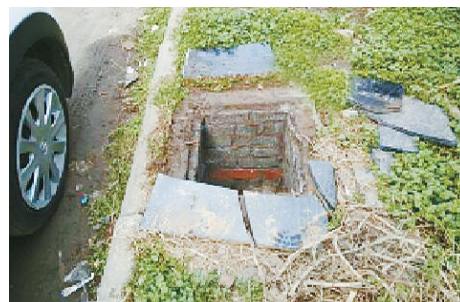
金江路与文化路交叉口向西约80米路南，污水井盖缺失。