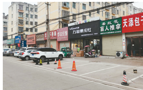
环城路建材市场，商家用反光锥私占停车位。