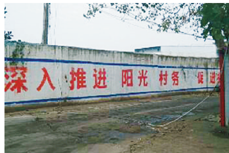
渭河路与银鸽路交叉口向东约300米路北，线缆落地。