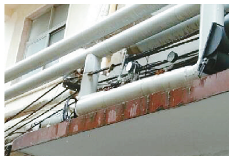
双汇路双汇小区北院西栋北单元门前，热力管道破裂。