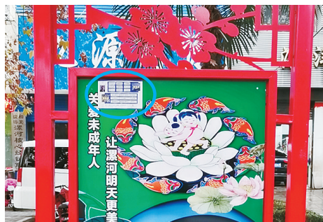
黄河路华山市场门口东边公益广告牌，小广告乱贴。