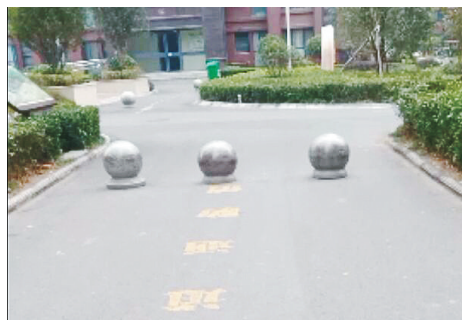
交通北路广天颐城小区，消防通道被石墩挡住。