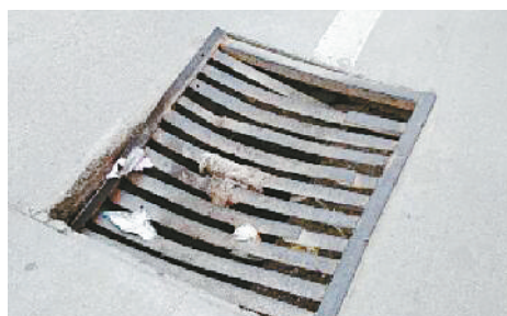
东山东路与人民路交叉口向南约300米路西，雨水篦子塌陷、断裂。