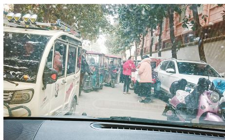
漯河叔重幼儿园南校区，家长进入小胡同接送孩子，导致道路堵死。