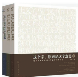
▲《这个字,原来是这个意思》封面