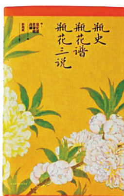
▶《瓶史 瓶花谱 瓶花三说》封面

分,由荧光橘红色印有银色图形的短页相隔。全书没有过多的文字,用图像来演绎主题。整本书充满了黑白与光影交织的音乐旋律感。