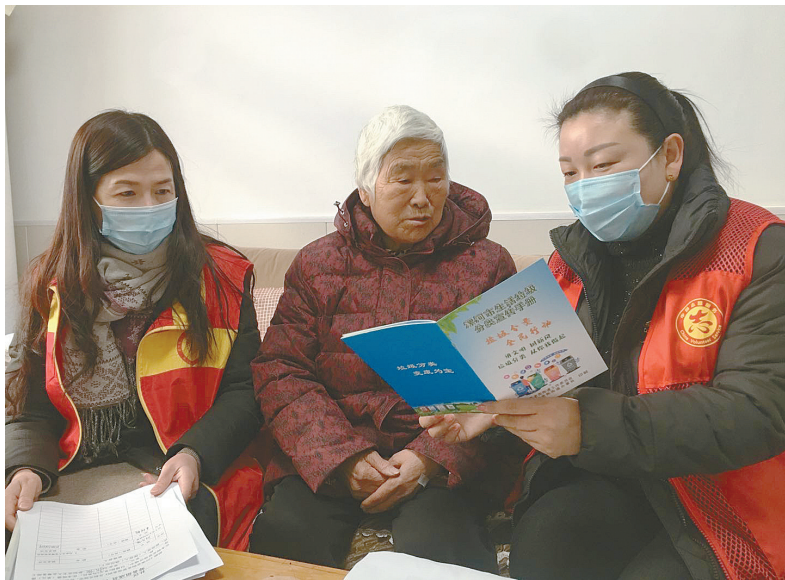
12月23日,源汇区老街街道新华街社区志愿者走进小区,向居民宣传垃圾分类知识。