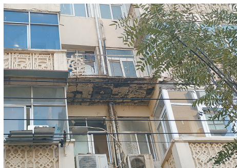
人东一巷南口向北50米路东4楼违章搭建。