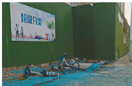
黄山路北段太阳城小区对面,共享单车随意乱放。