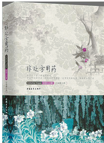
《非处方用药》 爱斐儿 著

作者爱斐儿基于自己是一名医生的生活阅历，从所熟悉事物入手，把自身细腻又丰富的感情，别具匠心地注入一味味中草药，赋予这些虽苦涩但能够救人的中草药以生命光华与色彩，传递出对世界、自然、人性的无限热爱。“我