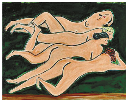
▲常玉《绿色背景四裸女》 成交价:2.583亿港元