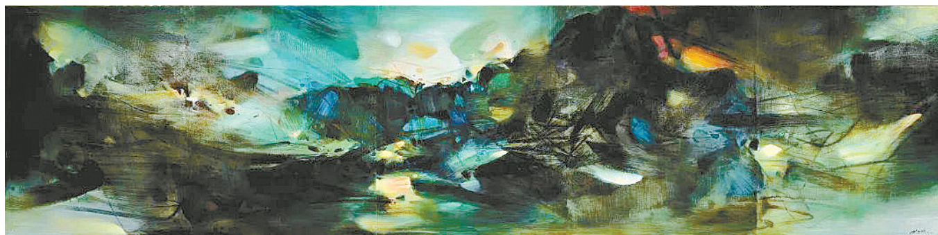
▲朱德群《自然颂》 成交价:1.137亿港元