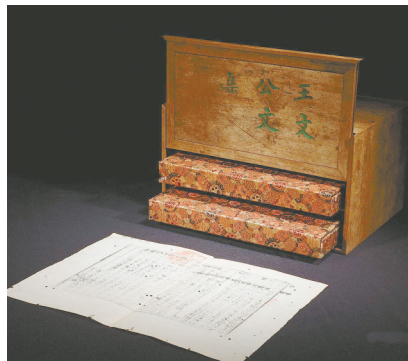
▲南宋 宋龙舒本《王文公文集》 成交价:2.6335亿元