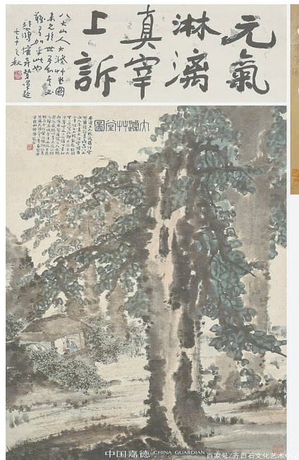
▲傅抱石《大涤草堂图》 成交价:1.38亿元