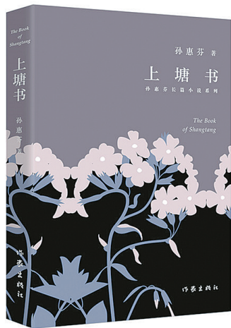
《上塘书》 孙惠芬 著

全书共分九章,分别写了上塘的地理、政治、交通、通信、教育、贸易、文化、婚姻、历史。在对这九个方面的叙述中,一个立体的上塘村跃然纸上。上塘的四十几户人家、几百亩水田、几百亩旱田,上塘的房屋,上塘的三条街、甸道和山道,上塘的高丽老井等,共同构成了上塘人温馨的家园:夜一旦降临,上塘便黑下来,房屋、院子、屯街、草垛、田畴、土地便统统睡着,进入